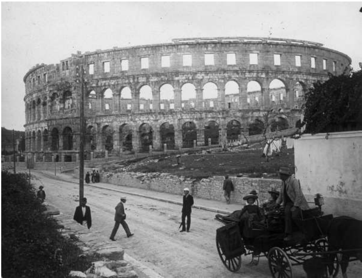
A pulai amfiteátrum, 1900-körül