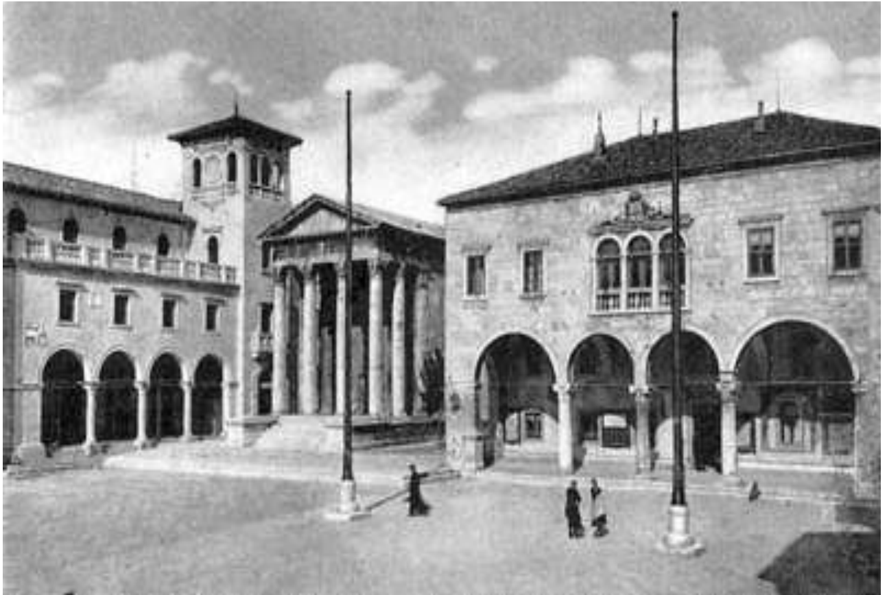
Pula főtere az 1800-as évek végén