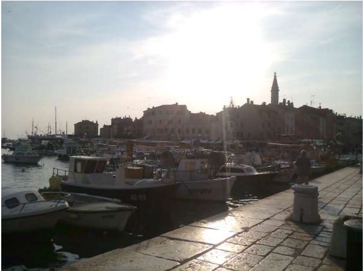
A rovinji déli kikötő 2015 nyarán