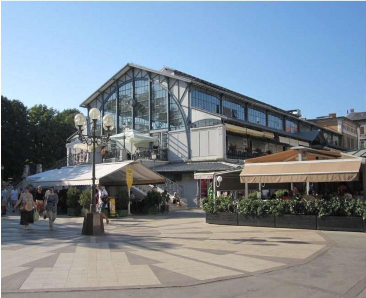
A vásárcsarnok épülete 2011-ben