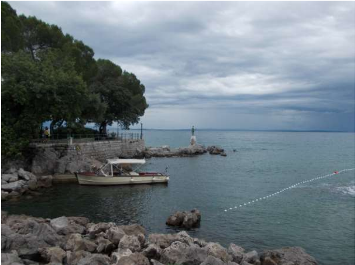
Zvonko Car alkotása, a „Lány sirállyal” 2014. júliusában, Opatijában, a „Madonna Del Mare” helyén