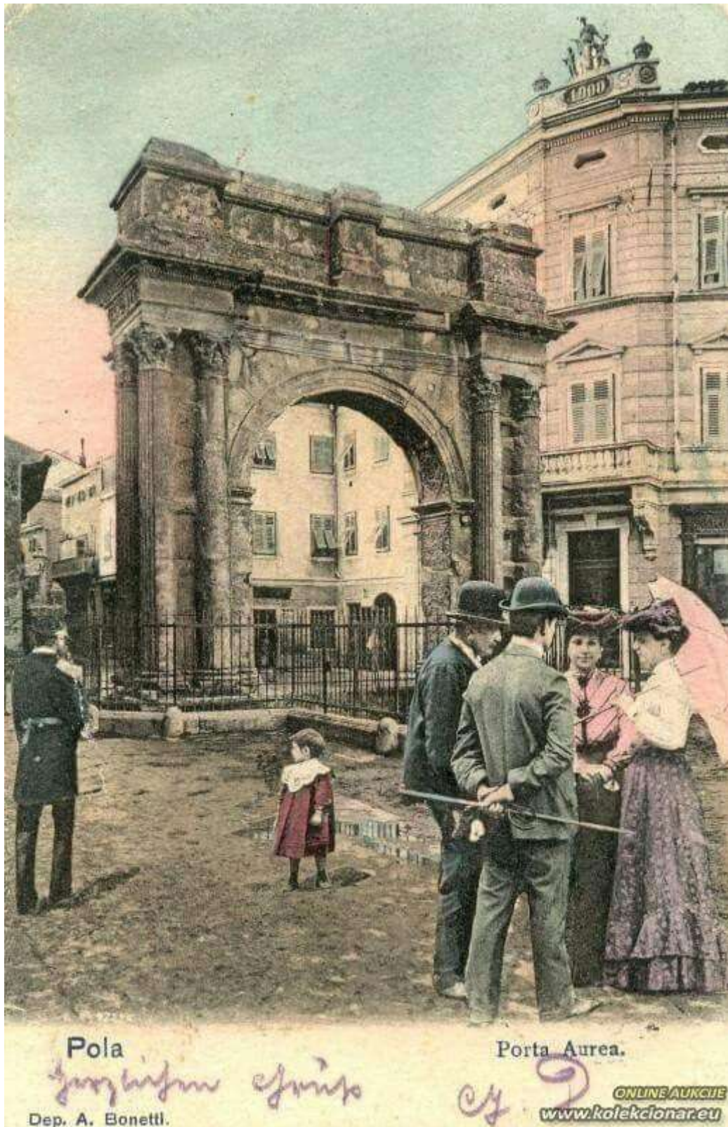
A Sergius diadalív, azaz a Kr. e. 31-ben épült Aranykapu 1900-ban, ami szinte bejáratként szolgál Pula óvárosának szűk utcáiba