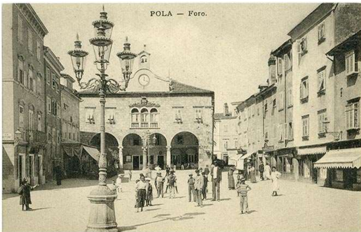
A pulai városháza épülete 1900-ban