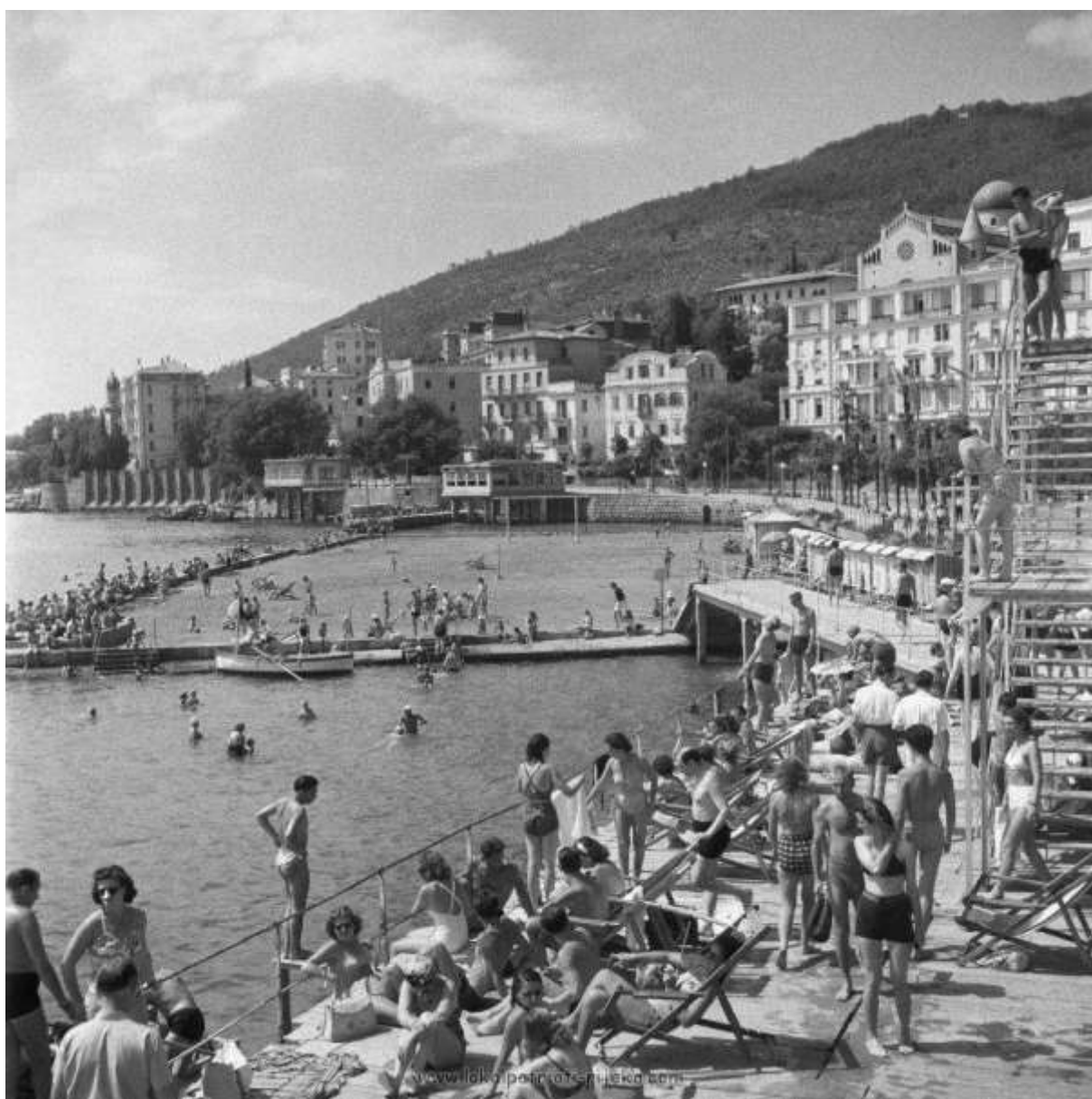
Opatija központi strandja az 1970-es évek tájékán