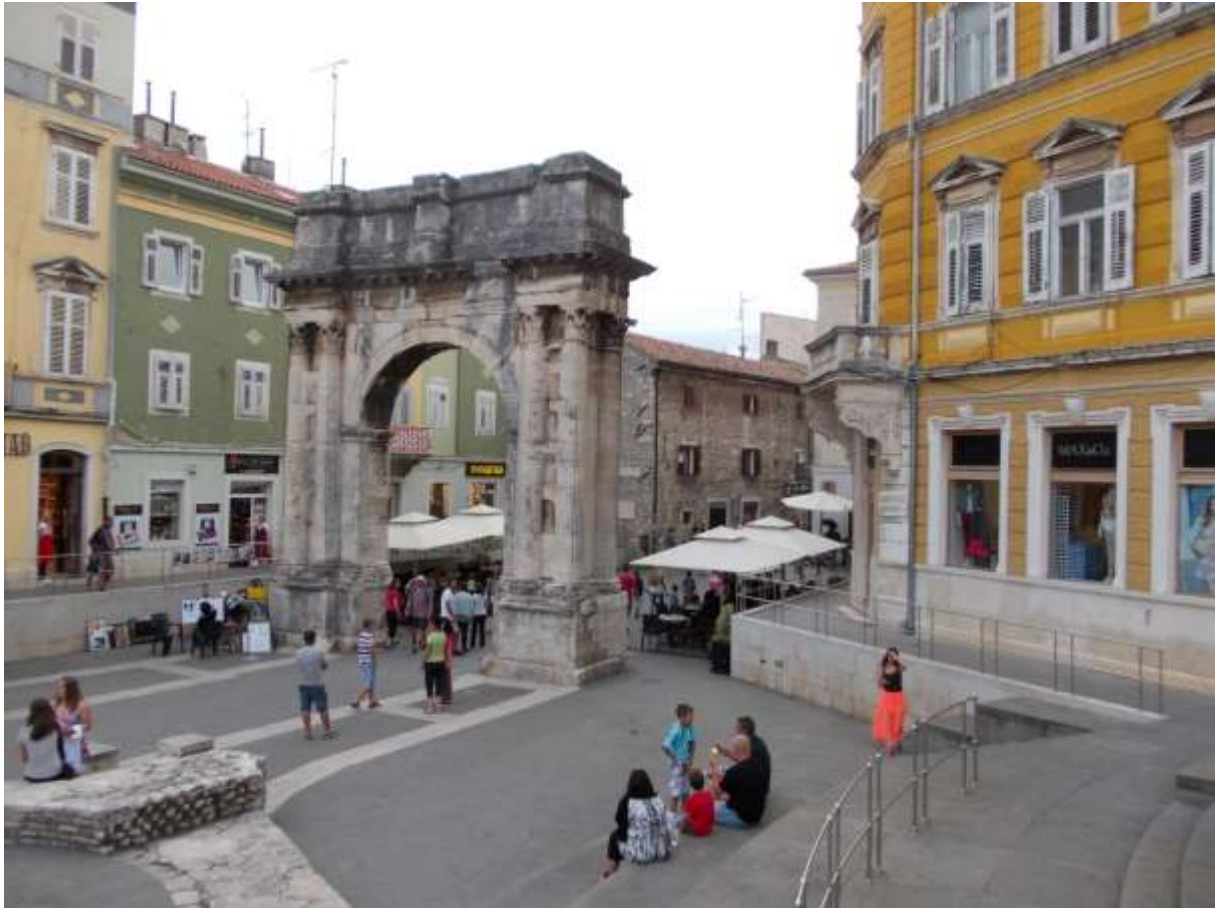
Az Aranykapu 2014 nyarán