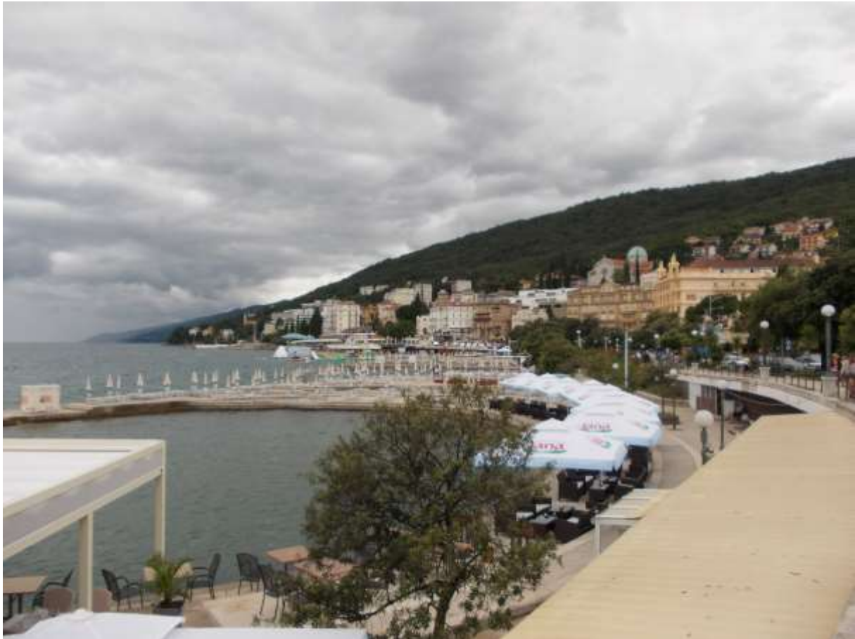
Az opatijai nagystrand fél évszázaddal később, 2014 nyarán