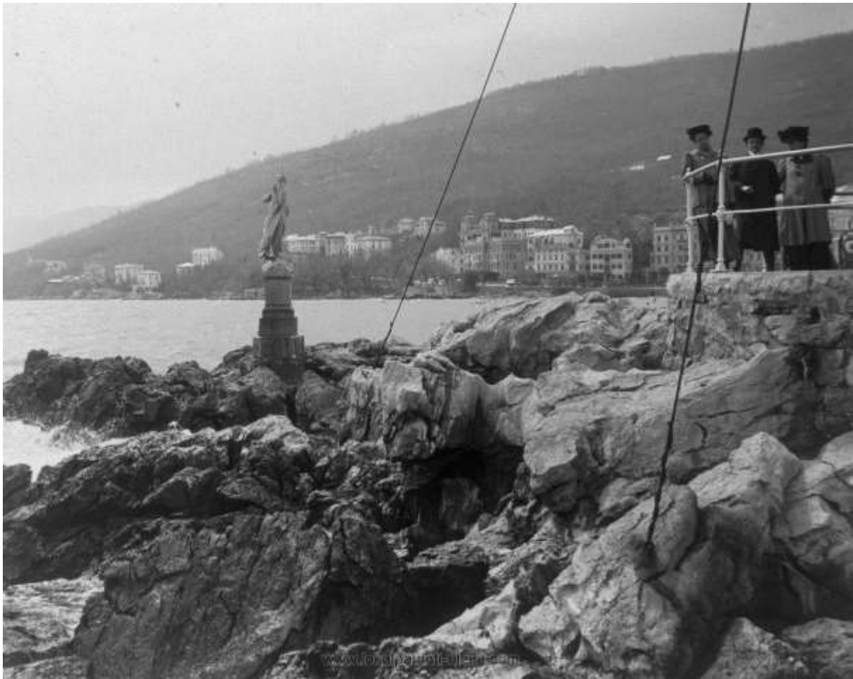
Abbázia 1900-ban, előtérben a „Madonna del Mare” szoborral