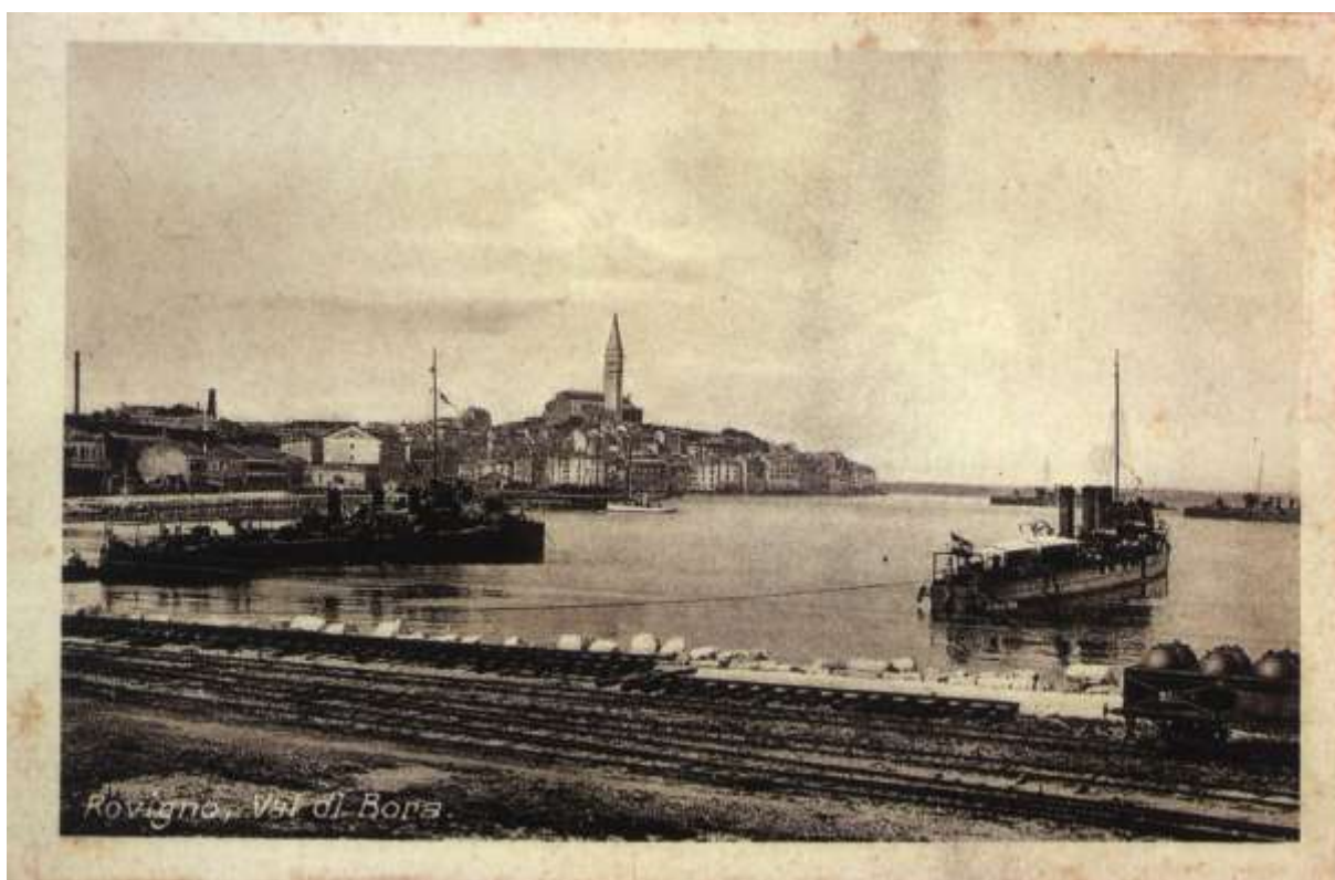
Rovinj látképe a várostól északra fotózva, az 1900-as évek elején