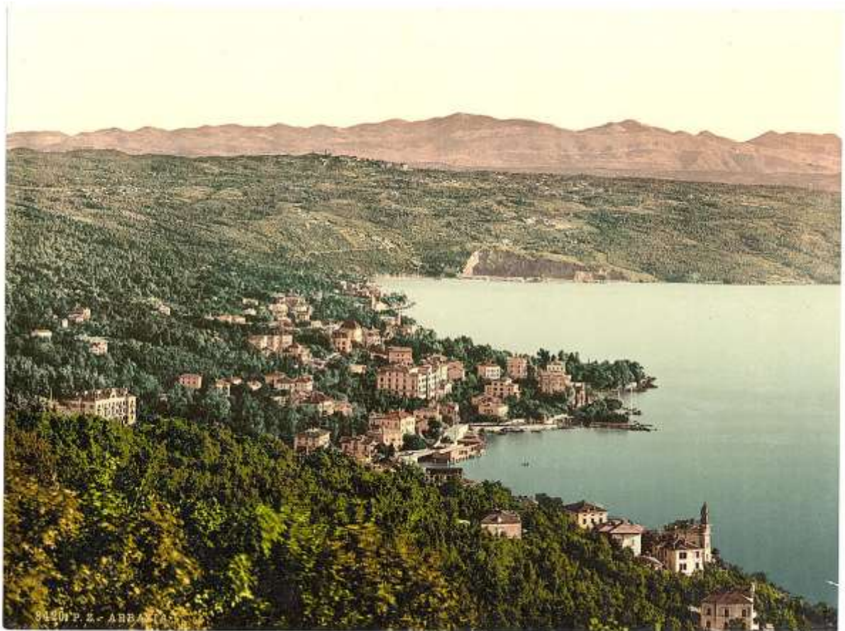
Abbázia látképe Ičići felől, 1901-ben