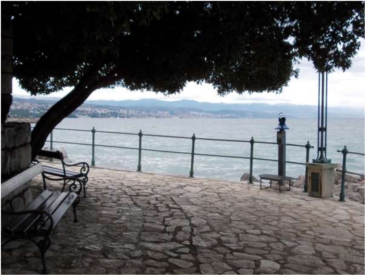
A látkép a sétányról egy évszázaddal később, 2014 nyarán