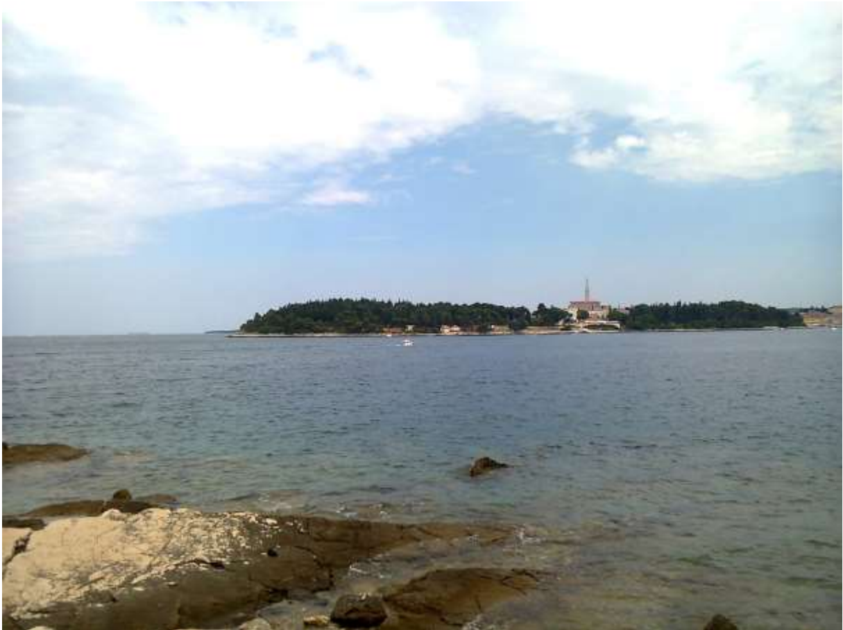
Rovinj déli irányból nézve, 2013. júliusában