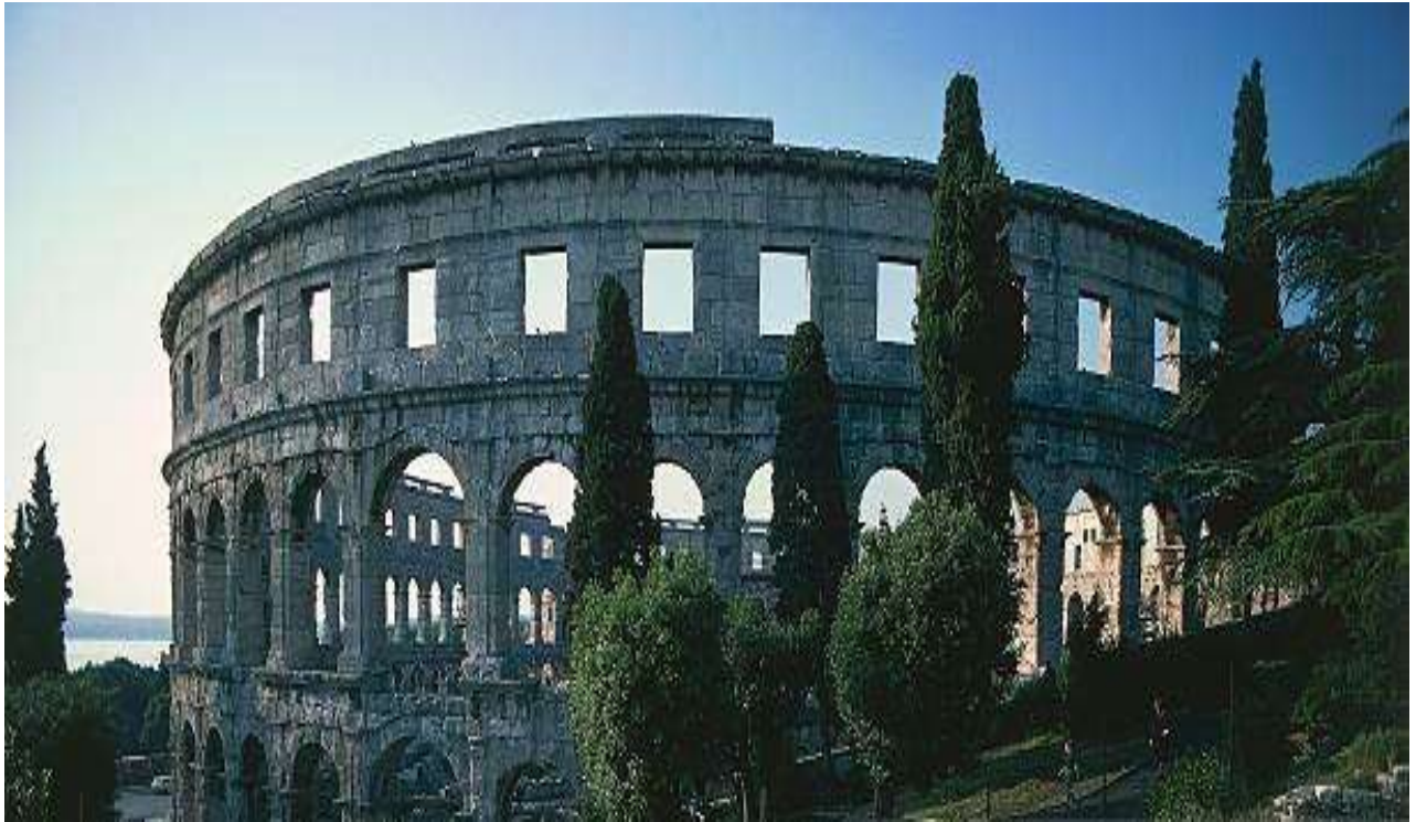
Az amfiteátrum épülete ugyanonnan fotózva, 2012-ben