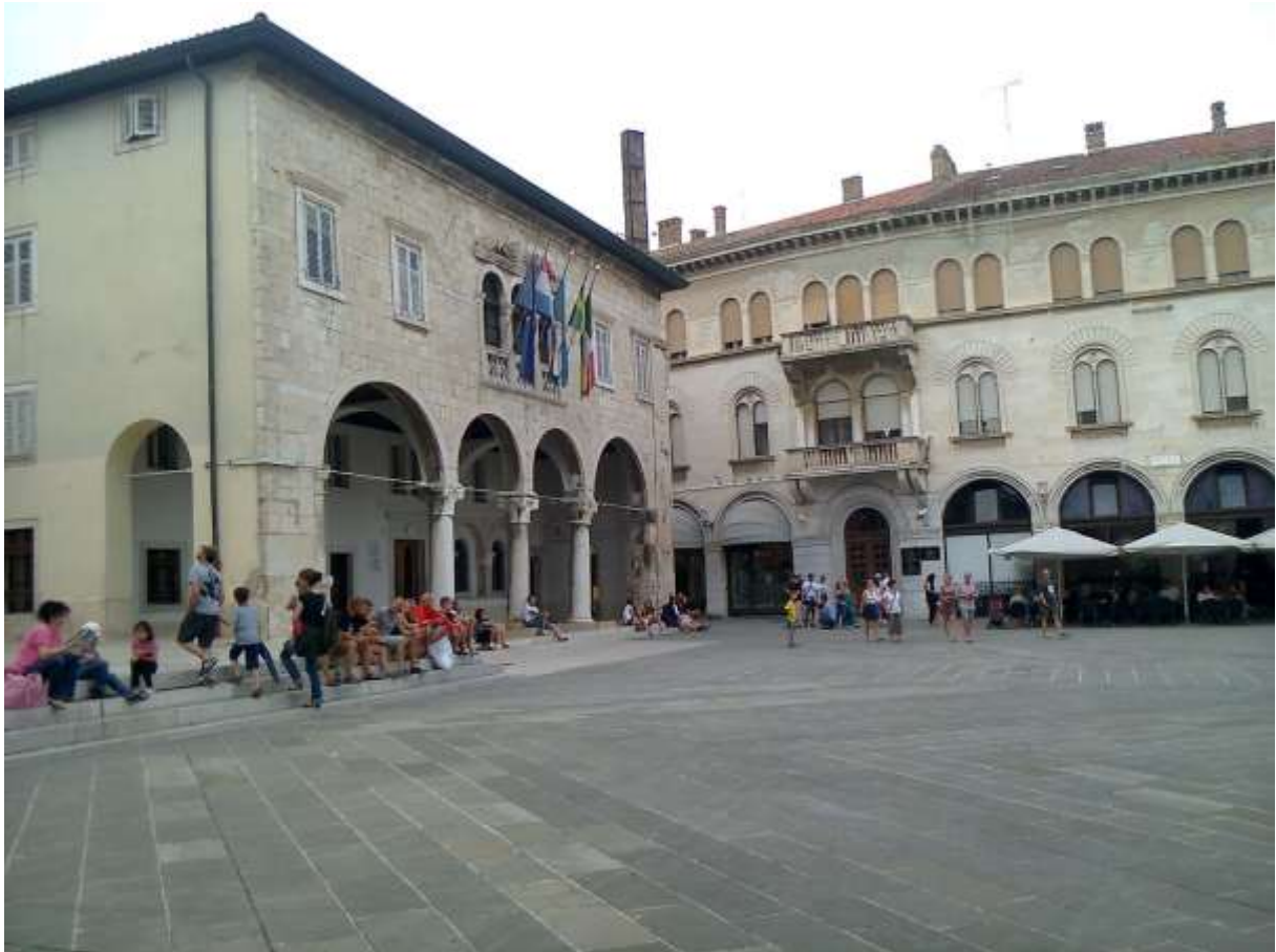
A városháza 2014 nyarán