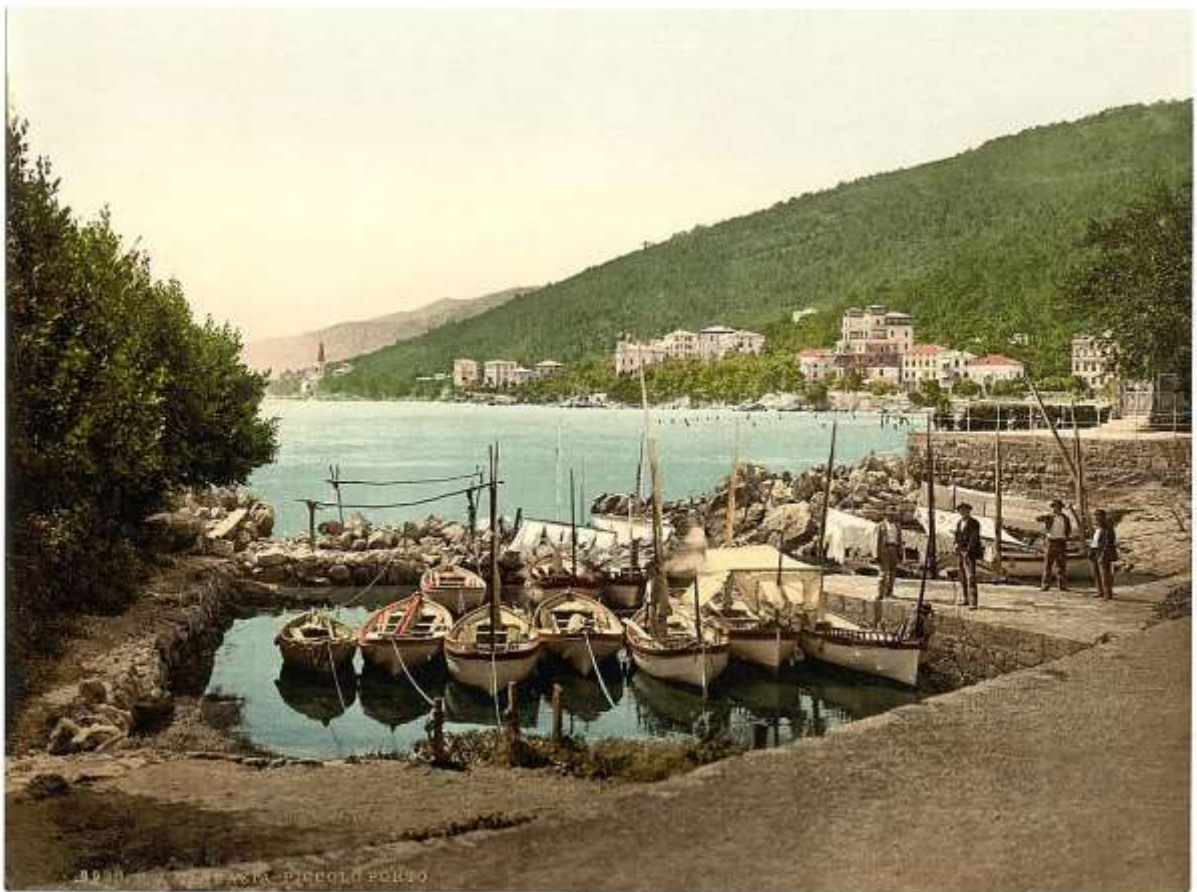
Abbázia 1900 körül, előtérben a Kis Kikötő, háttérben az üdülővároska látképe