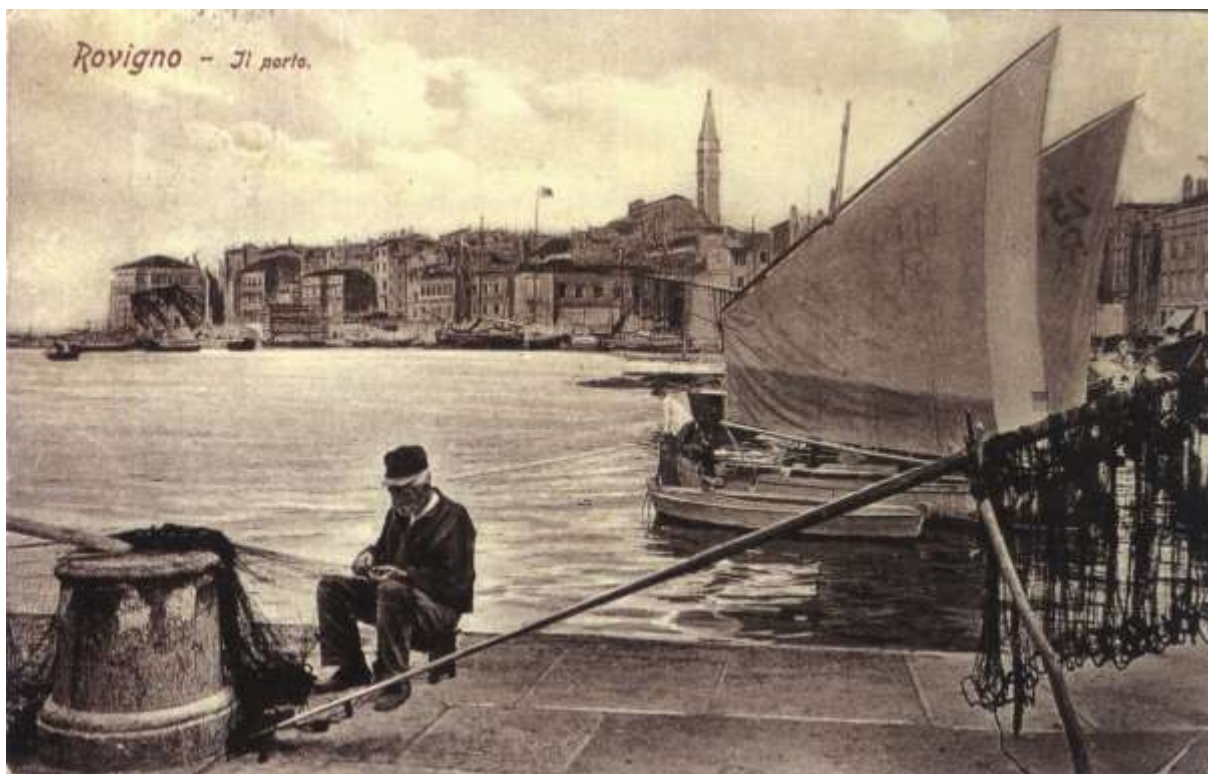
Rovinj déli kikötője a 19. és 20. század fordulóján