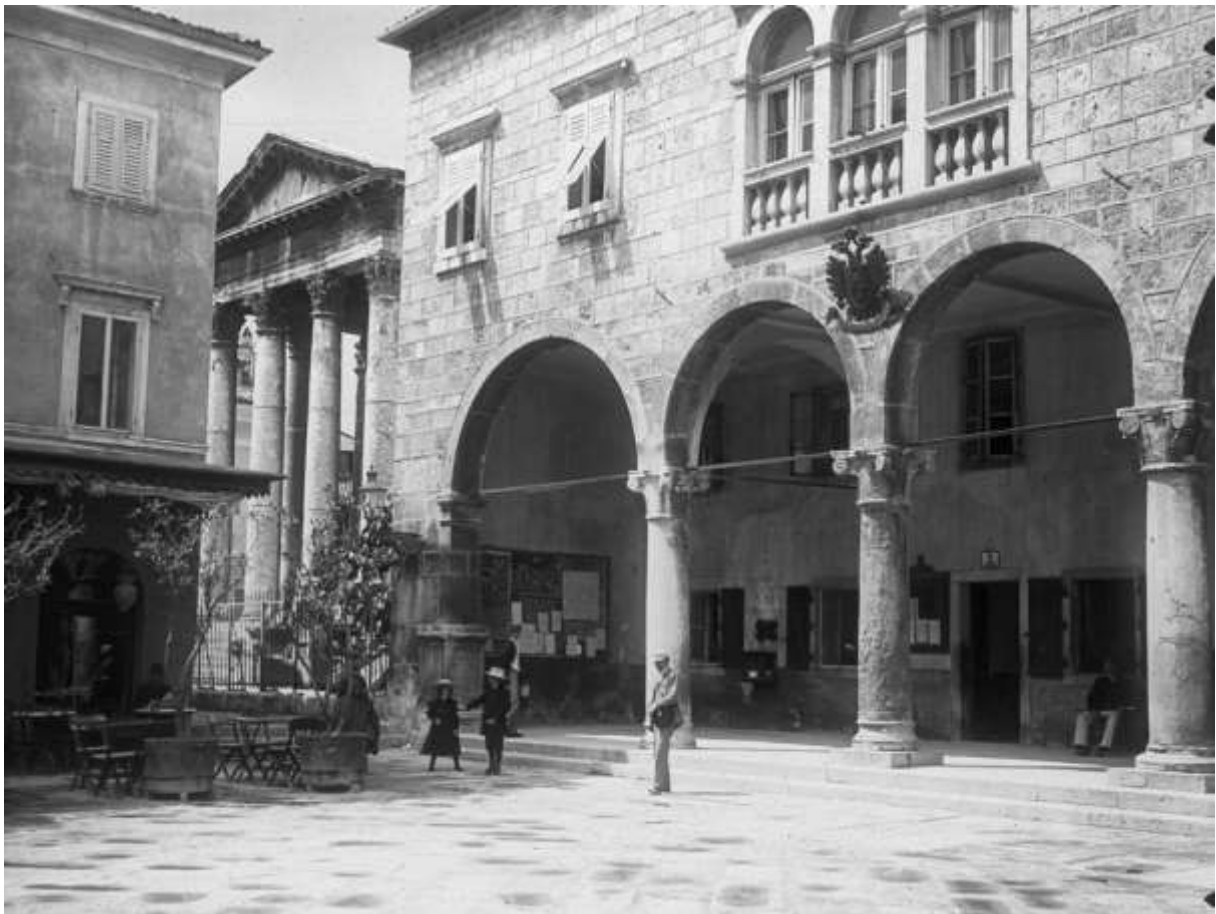
A városháza épülete Pula főterén, mellette az Augustus templom, 1900 körül