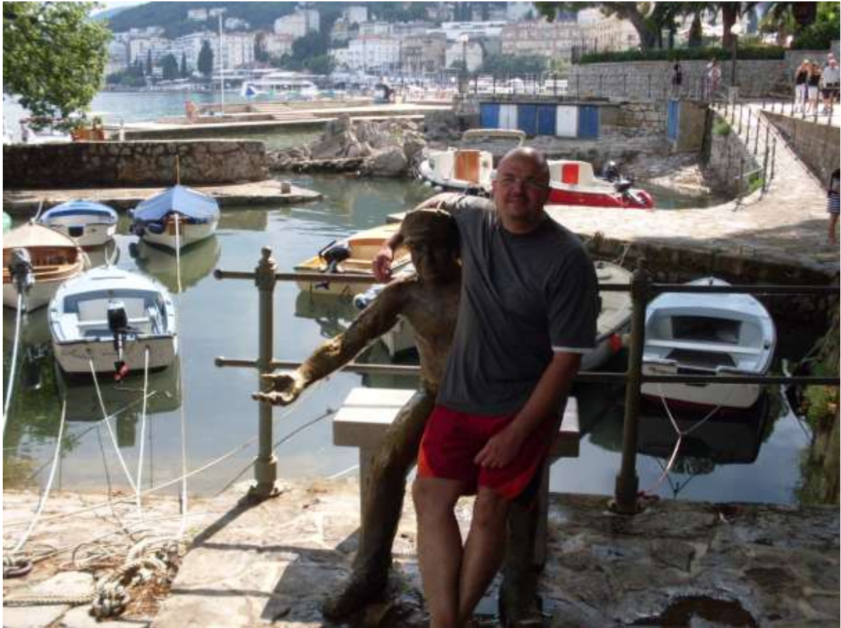
Az opatijai Kis Kikötő, 2015. júniusának végén