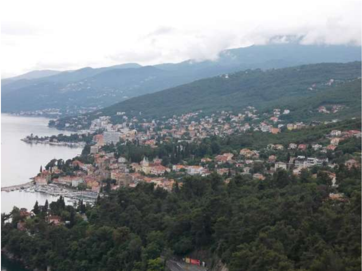
Opatija látképe 2014. júliusának közepén, Matulji felől fotózva