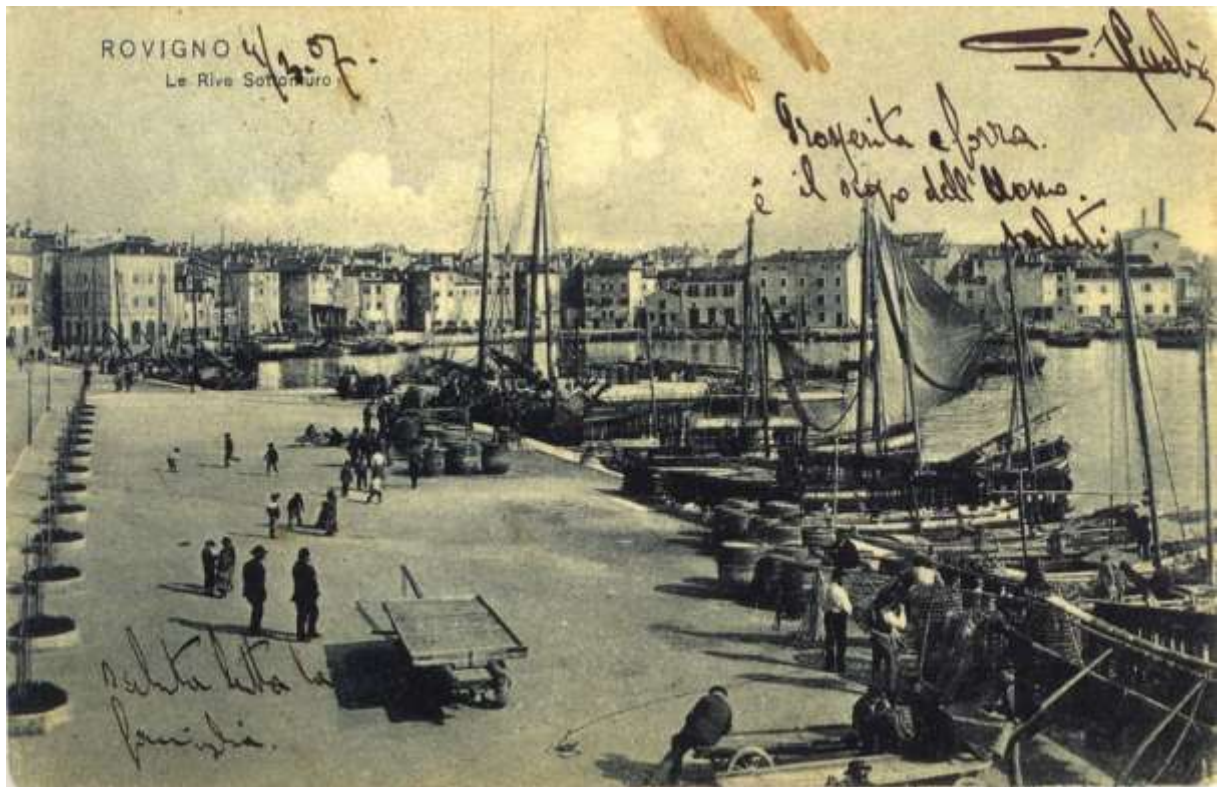
Rovinj déli kikötője az 1900-as évek legelején