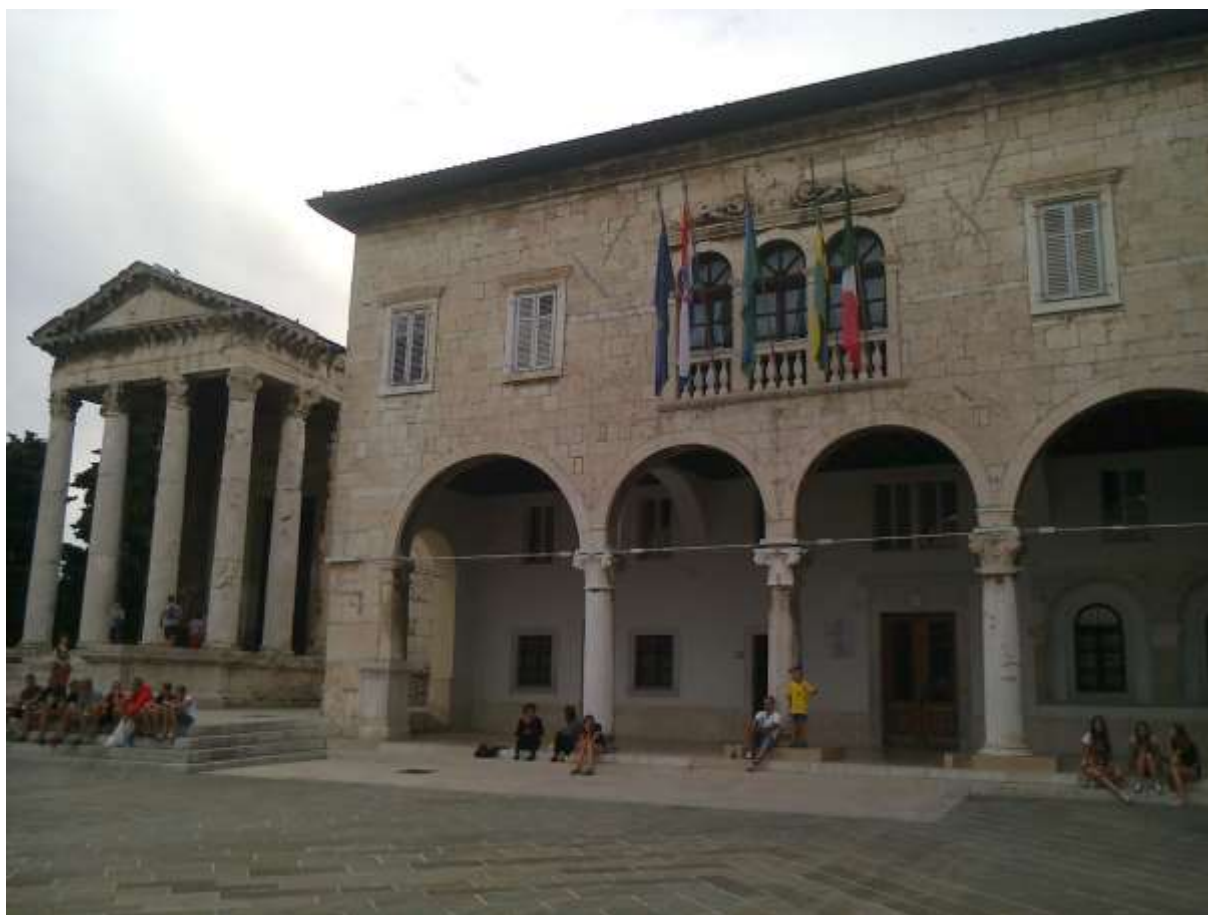
A városháza és a templom 2014-ben