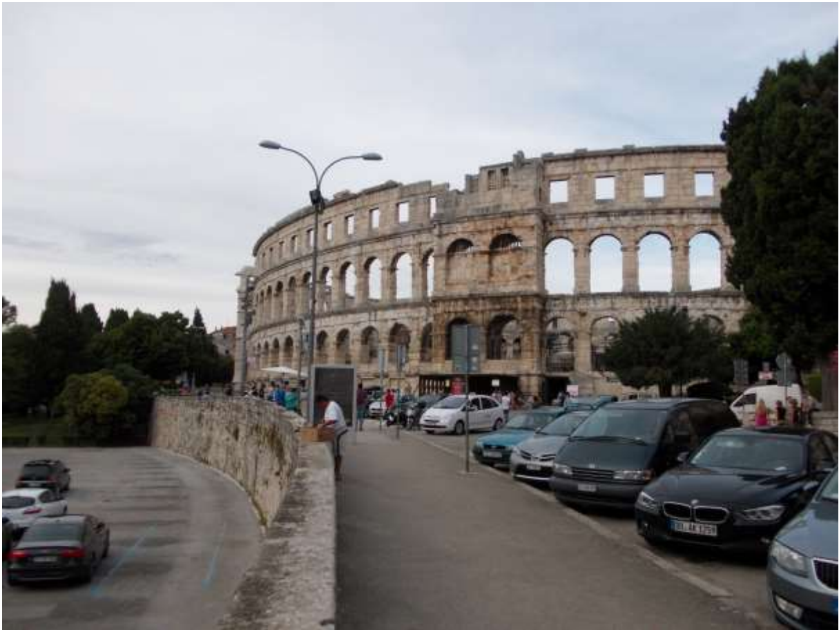
Az amfiteátrum 2014 nyarán