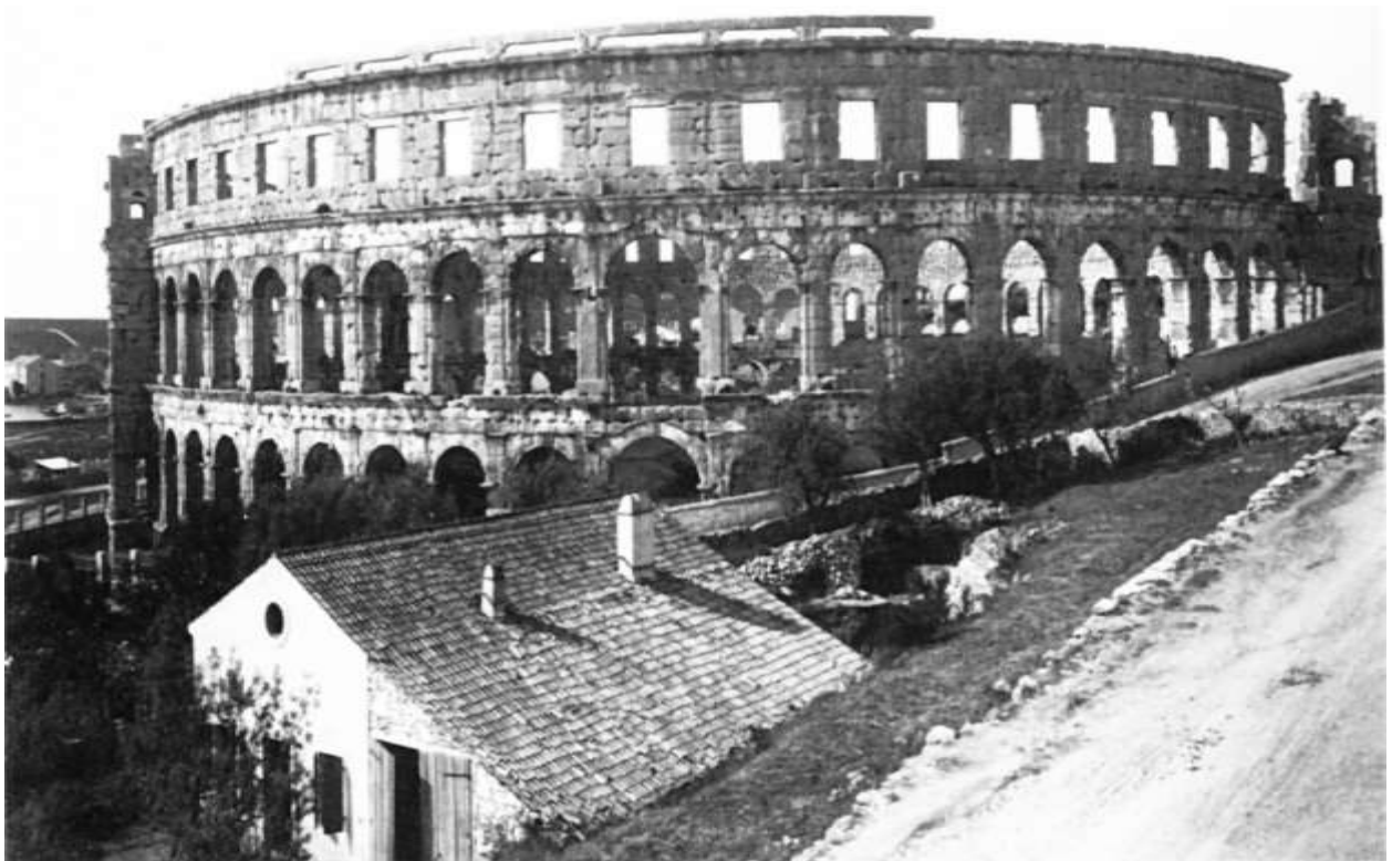
Az 1. században épült pulai amfiteátrum 1900-ban