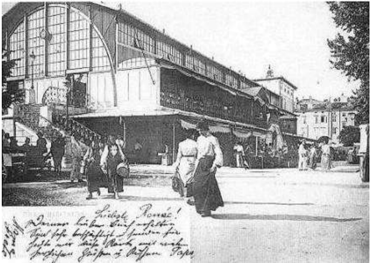
A pulai vásárcsarnok 1906-ban