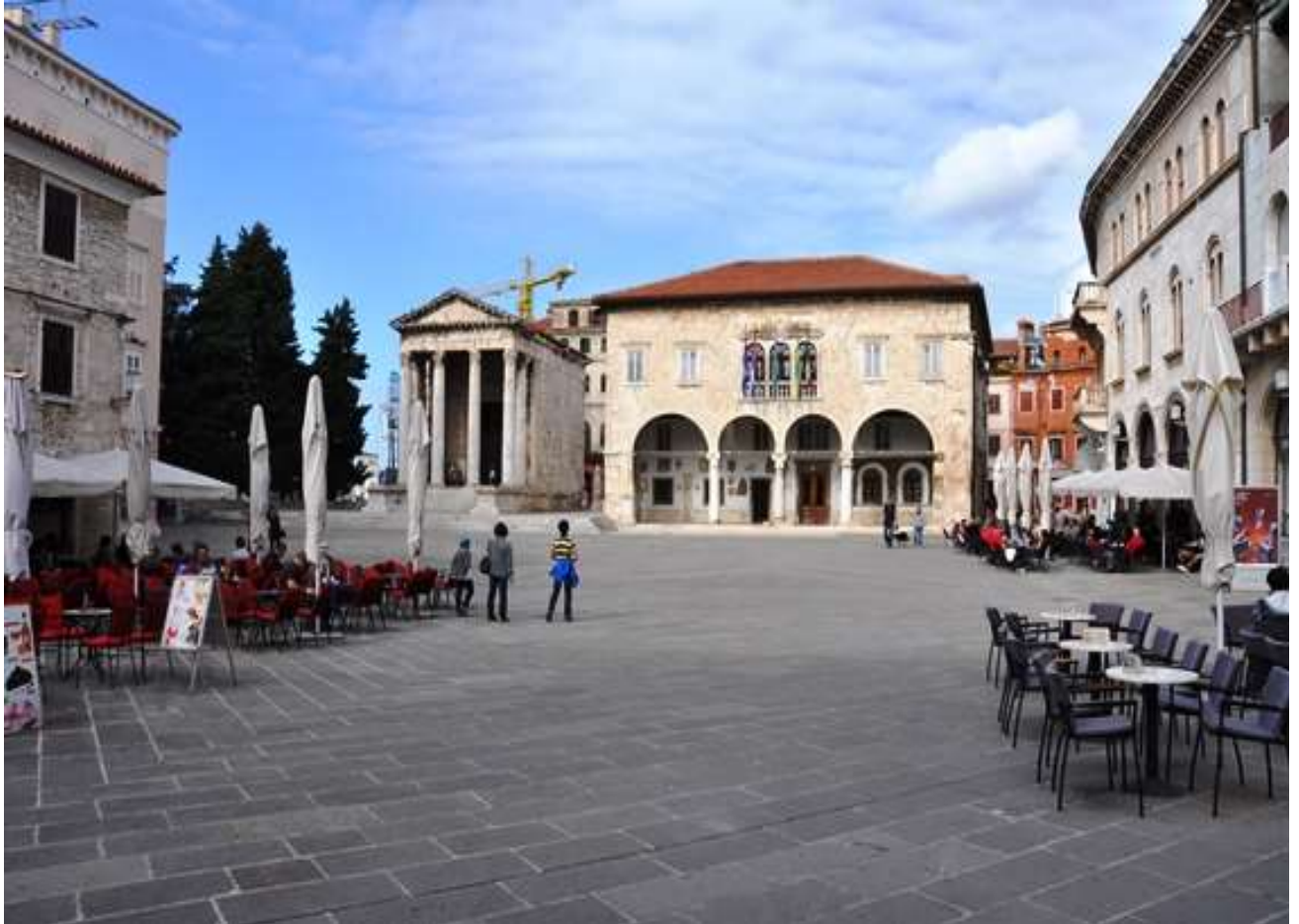
Pula főtere majd másfél évszázaddal később, 2013. novemberének elején