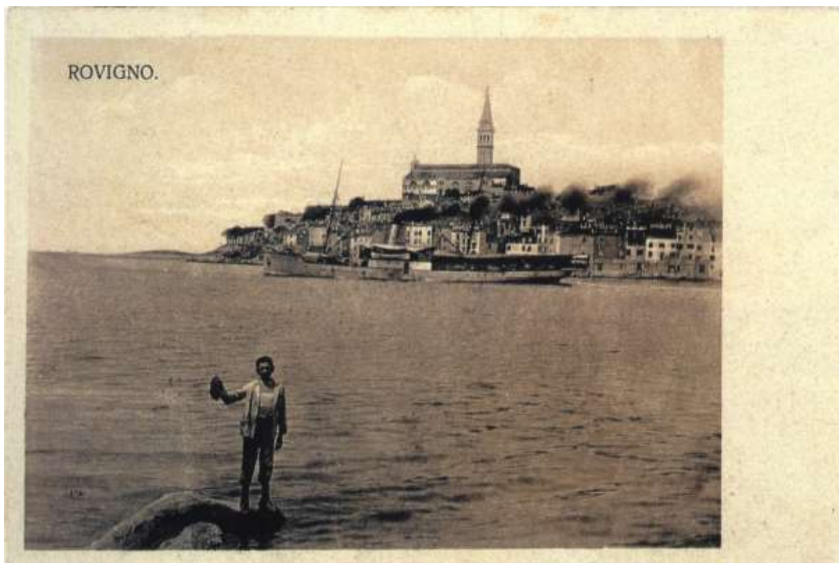
Rovinj látképe déli irányból fényképezve, az 1800-as évek legvégén