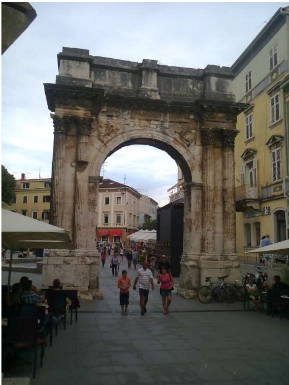
Az Aranykapu 2014. júliusában, az óváros felől fotózva