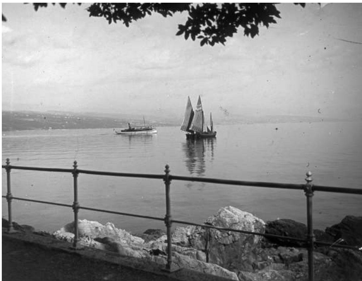
Fiume látképe Abbáziából, az I. Ferenc József sétányról, 1908-ban