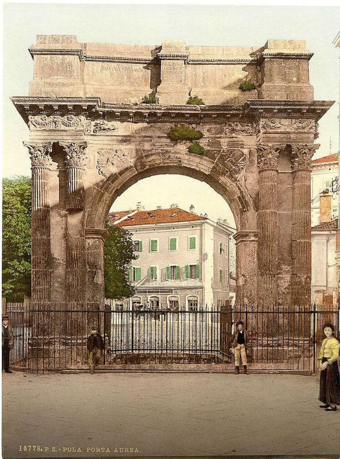
A diadalív a 19. század végén, az óváros felől nézve