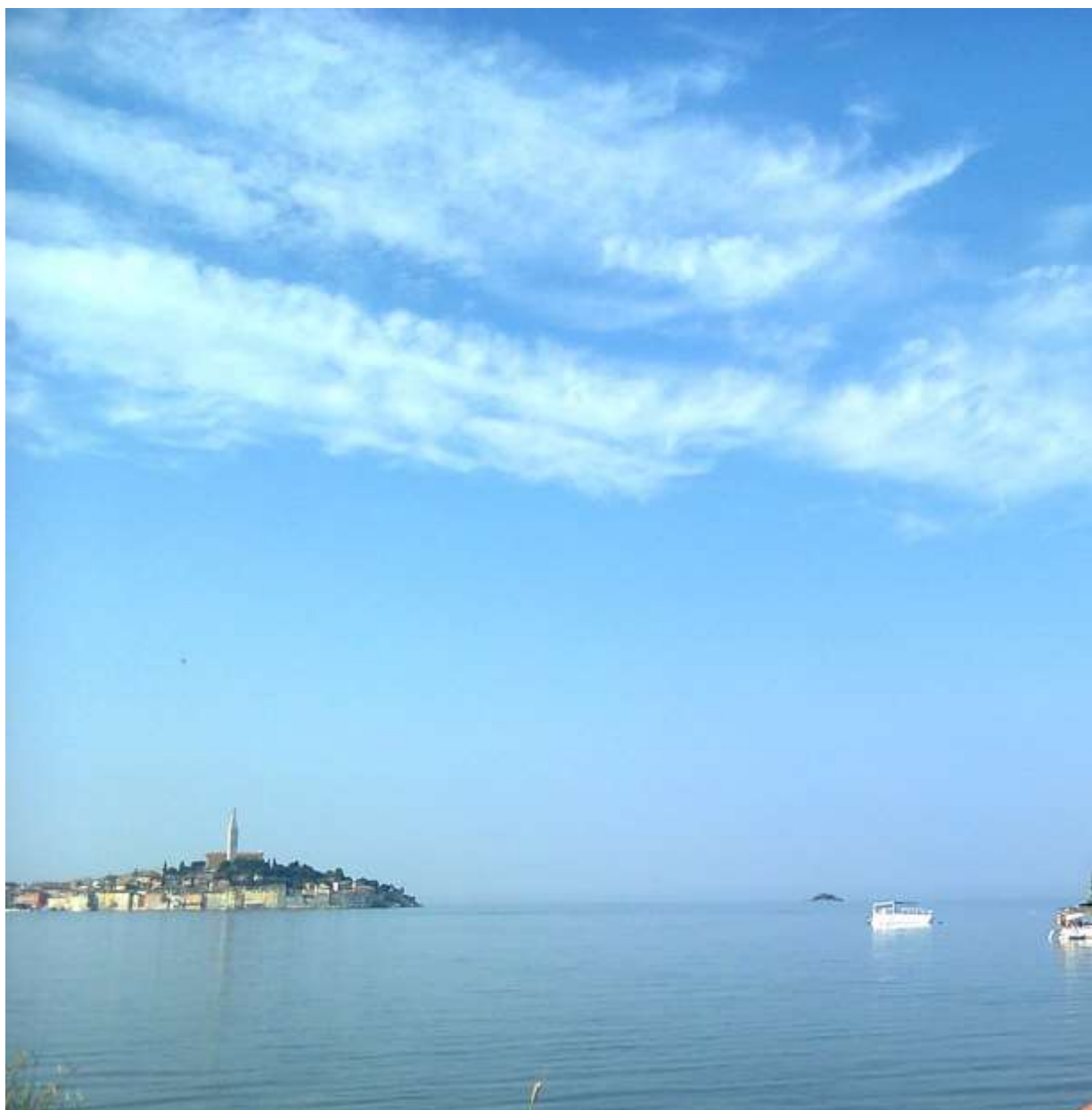
Rovinj északi irányból fotózva 2013 nyarán